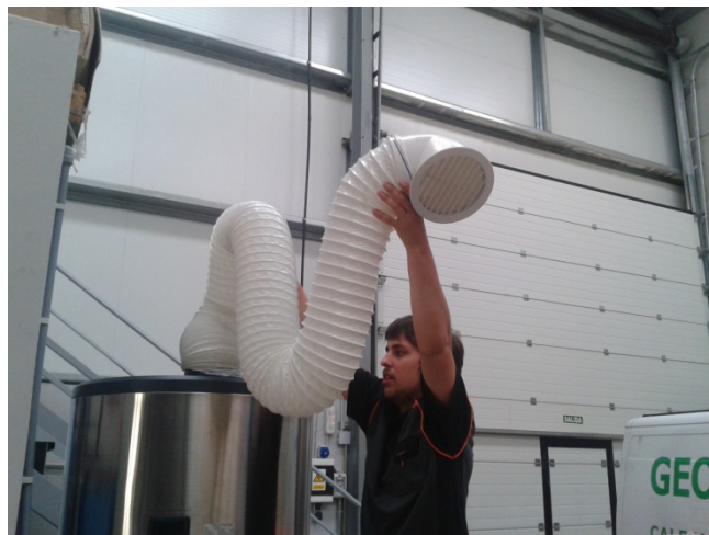
Conexión de conducto flexible de plástico. Diámetro 150 mm